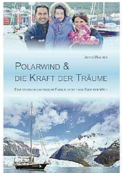
Otra de sus publicaciones donde aborda su experiencia luego de la travesía en su yate Polarwind.