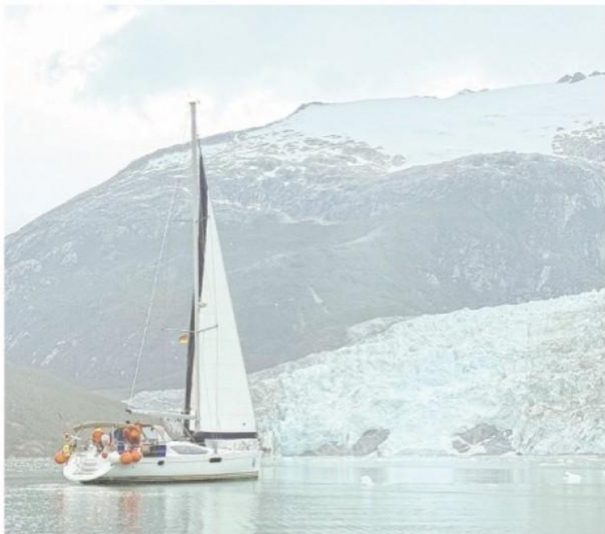
Aproximación al fiordo y glaciar Pia.