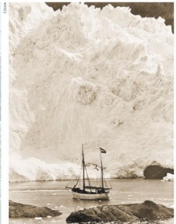
Gunther Plüschow también navegó a pocos metros de los glaciares.