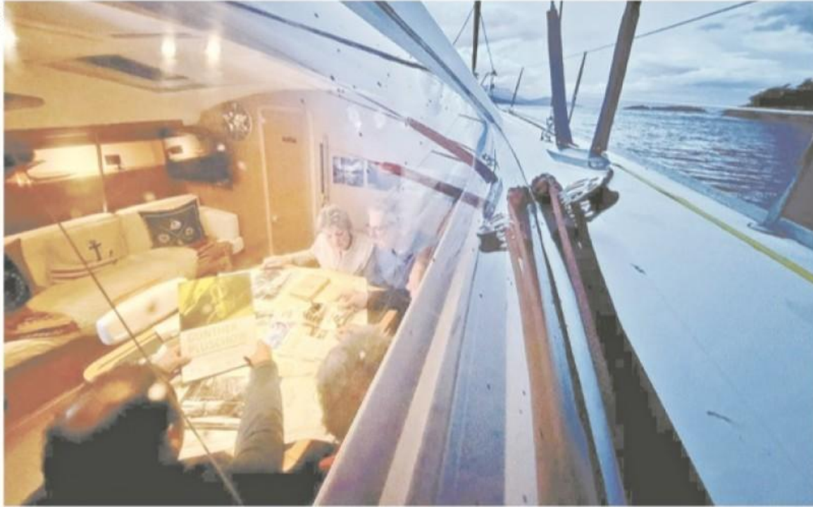
Durante la navegación, la tripulación aprendía de la historia y exploraciones de Plüschow.

El proyecto a 100 años de la llegada de Gunther Plüschow a la Patagonia no busca sólo recrear una ruta náutica, sino saldar deudas de memoria cultural en Chile. Mientras el velero descansa en las aguas de la caleta, la figura de Plüschow cobra una vigencia renovada junto al timón de Torres: que este "país de las maravillas" deje de ser un confín olvidado y se convierta en un puente entre dos naciones