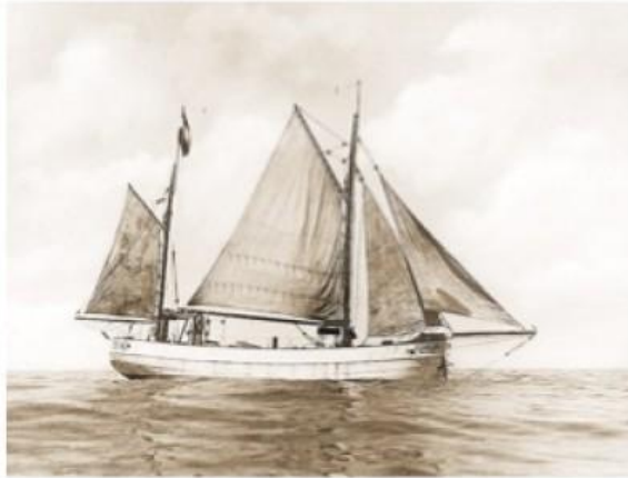
El velero con el que llegó Gunther Plüschow a los mares australes.

El alemán llegó por primera vez al cabo de Hornos hace poco más de un siglo, en 1925 como tripulante del buque Parma. Posteriormente, cumplió el sueño de construir su propio barco, el Feuerland, un velero de 15 metros, con el que regresó a Punta Arenas en 1928. Plüschow describió la zona como el "país de las maravillas", sin hablar de límites geográficos entre Chile o Argentina, sino de una Pa-