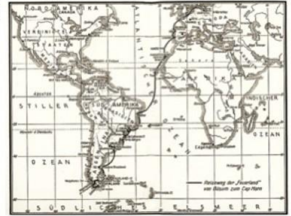
Esta ruta siguió el explorador alemán desde Europa hasta la Patagonia.