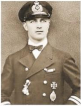
Por sus hazañas en China y el libro que escribió, Gunther Plüschow fue conocido como el aviador de Tsingtao.

Gran Bretaña y del fuego cruzado en la Estación Naval alemana de Tsingtao, registró esas hazañas con pericia y agudeza de cronista. Fue, además, el primer hombre en explorar y fotografiar desde los aires la región de Tierra del Fuego y la Patagonia.