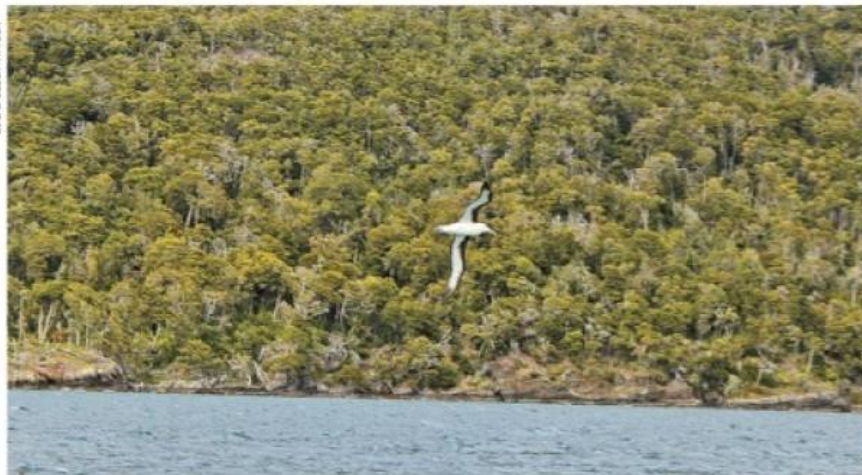
Muchos albatros acompañaron la navegación hasta Puerto Toro.