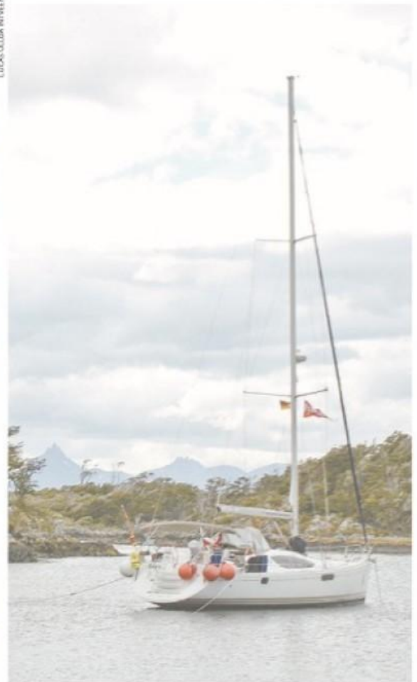
Península Dumas, isla Hoste.

intacta: una "escuela de la humildad" ante la fuerza indómita de los océanos. Esta