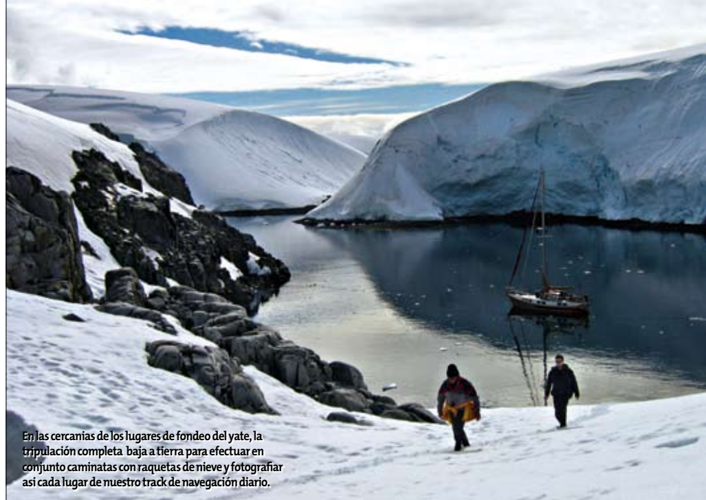
En las cercanías de los lugares de fondeo del yate, la tripulación completa baja a tierra para efectuar en conjunto caminatas con raquetas de nieve y fotografiar así cada lugar de nuestro track de navegación diario.

Después de dos entretenidos días con la dotación de esta base, nos preparamos para zarpar de regreso con buen viento del sureste y poner velas hacia el norte, visitando otros interesantes lugares antes de nuestro último cruce hacia Cabo de Hornos. La presencia de hielo en los canales es considerablemente mayor en comparación con los días anteriores, y por seguridad arriamos las velas y continuamos con