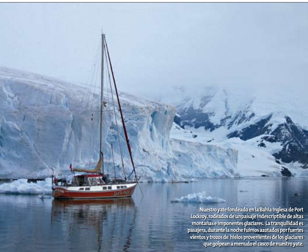
Nuestro yate fondeado en la Bahía Inglesa de Port Lockroy, rodeados de un paisaje indescriptible de altas montañas e imponentes glaciares. La tranquilidad es pasajera, durante la noche fuimos azotados por fuertes vientos y trozos de hielos provenientes de los glaciares que golpean a menudo el casco de nuestro yate.