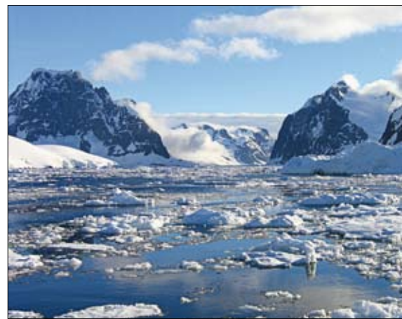
△ Uno de los lugares de mayor atracción para los navegantes de Yates en la península antártica es sin duda, el famoso Canal Le Maire. A ambos lados del canal grandes montañas e imponentes glaciares son la puerta de entrada a una navegación inolvidable entre los hielos milenarios.

△ Una de las tareas principales de las guardias durante la navegación es la observación de hielos que se encuentran en nuestro rumbo, como también de reconocer sectores abiertos de hielos, que nos permitan navegar seguros y entre las grandes masas de hielos flotantes.