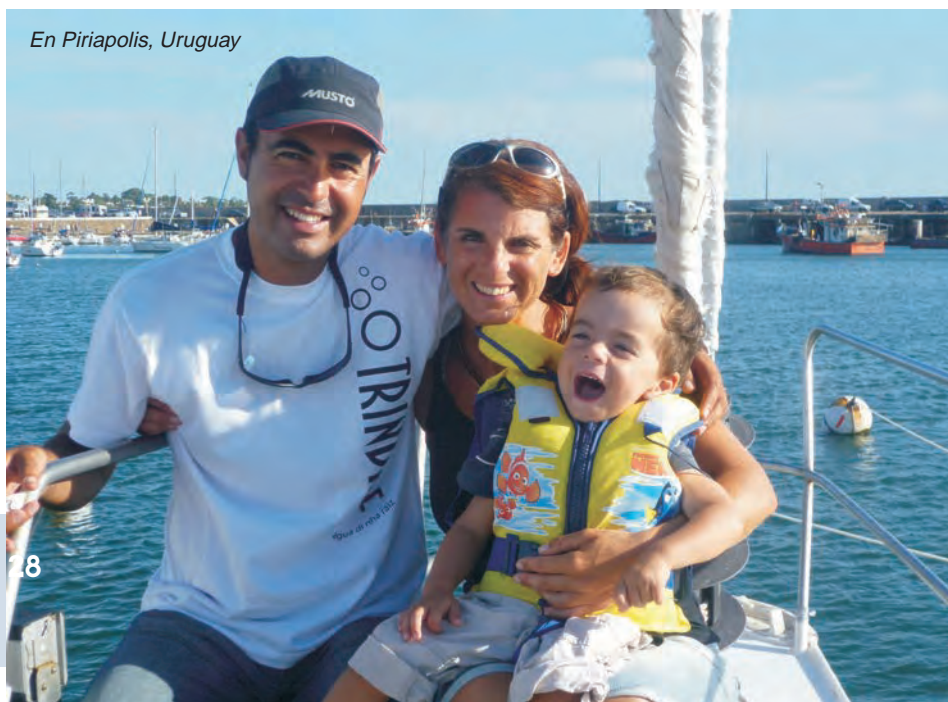
En Piriapolis, Uruguay