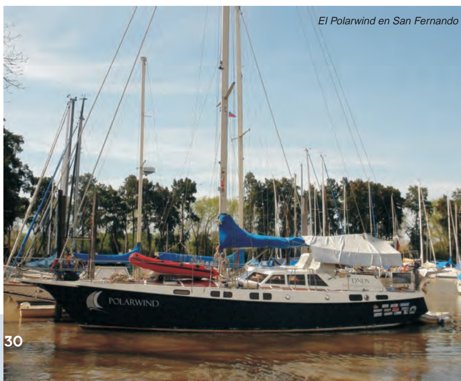
El Polarwind en San Fernando

Este tipo de barco Reinke (de construcción alemana) se hace famoso en la década del 70, en donde una pareja de alemanes, en el velero "Fraidys", se convierten en los primeros alemanes en ir a la Antártida en velero. Ese barco tenía unos 12 metros, luego de esa primera experiencia los constructores modifican los planos y lo van mejorando, sacando varios modelos hasta llegar al actual modelo del "Polarwind". Un velero totalmente expedicionario, calado de 1,80 metros, que le permite entrar en cualquier bahía a pesar de las 22 toneladas, tiene 1500 litros de combustible, 1500 litros de agua, tiene dos motores Volvo, siempre uno va a andar.