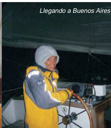
Llegando a Buenos Aires