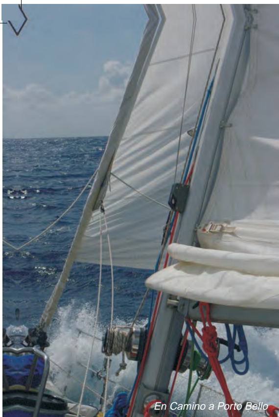
En Camino a Porto Bello