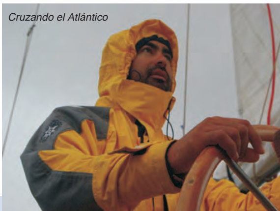
Cruzando el Atlántico