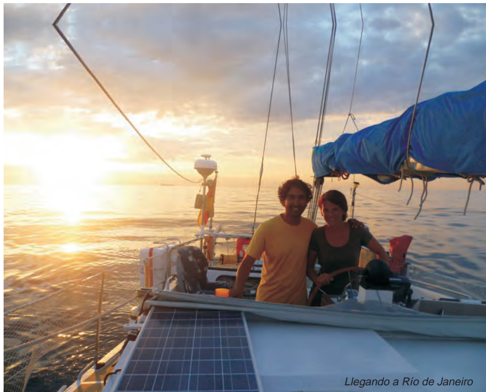
Llegando a Río de Janeiro

www.polarwind-expeditions.com info@polarwind-expeditions.com