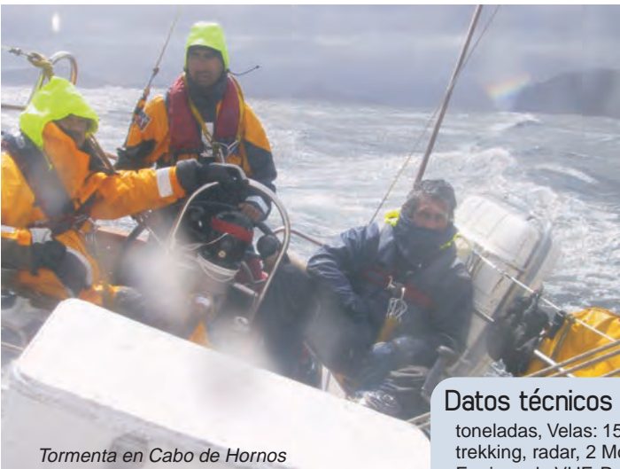
Tormenta en Cabo de Hornos

Tiene 150 m2 de vela, una maniobra de cubierta relativamente despejada, buena comunicación, un barco espectacular para las pretensiones de esta familia viajera.